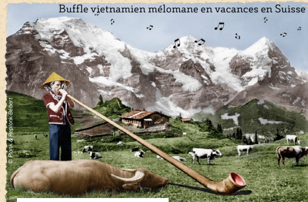
  Plonk & Replonk/Beibart